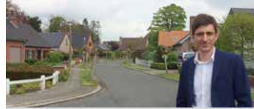
Lange Stukken en Hertenpad krijgen opfrissing p. 3