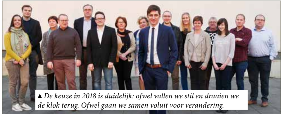
▲ De keuze in 2018 is duidelijk: ofwel vallen we stil en draaien we de klok terug. Ofwel gaan we samen voluit voor verandering.