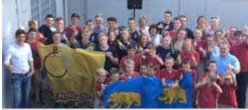
Nieuwe lokalen voor Chiro Oostveld p. 2